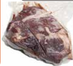
冷凍 鹿 モモ正肉 約3kg